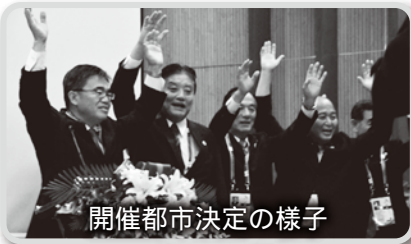
開催都市決定の様子

アジア・オリンピック評議会の総会がベトナム(ダナン)において9月25日に開催され、2026年の夏季アジア競技大会が、日本では1994年の広島以来32年ぶりに、「愛知・名古屋」で開かれることが決定しました。